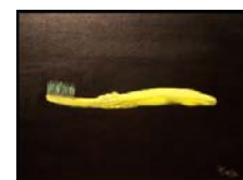
Bürste - gut gebürstet ist halb gewonnen -